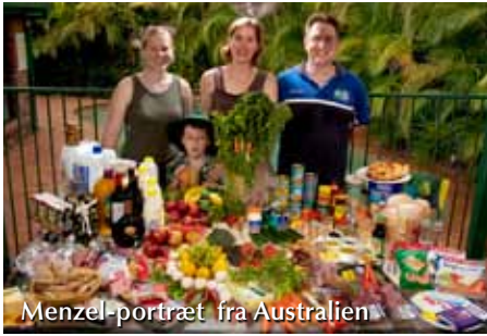
Menzel-portræt fra Australien