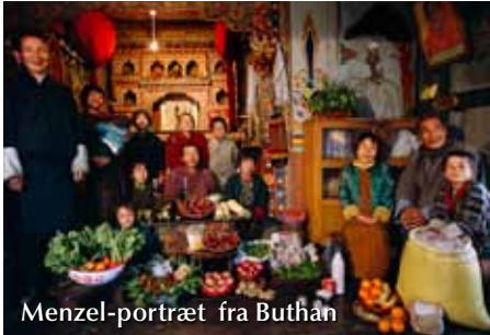
Menzel-portræt fra Buthan