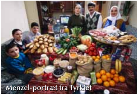
Menzel-portræt fra Tyrkiet